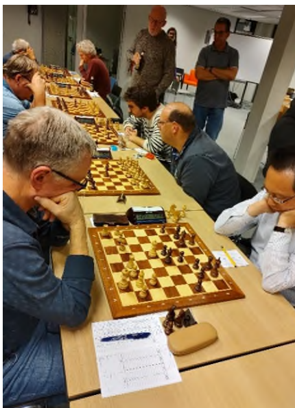
Onesimus 2 in actie