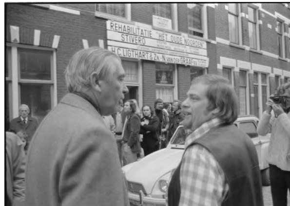
Jan met staatsecretaris Jan Schaefer

In totaal werden tijdens de stadsvernieuwing in de oude wijken 30.000 nieuwe betaalbare woningen gebouwd en 40.000 woningen door middel van hoog-niveau renovatie naar nieuwbouwkwiteit, genaamd "vernieuwbouw", verbeterd.